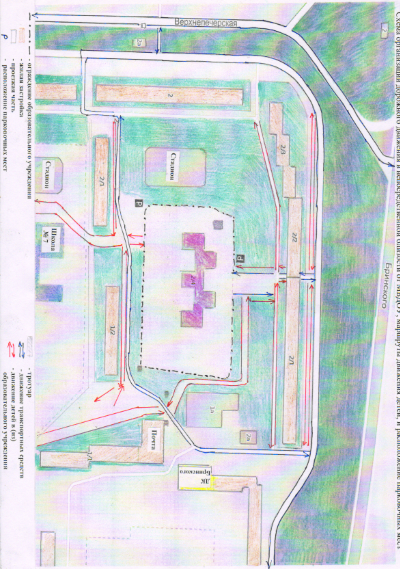
Схема организации дорожного движения в непосредственной близости от МБДОУ, маршруты движения детей, и расположение парковочных мест